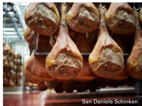
San Daniele Schinken