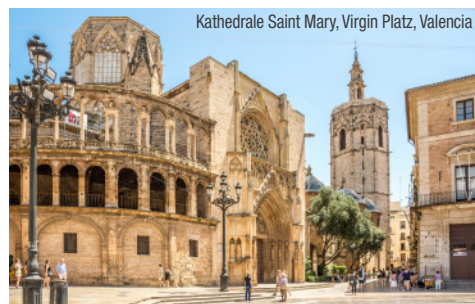
Kathedrale Saint Mary, Virgin Platz, Valencia

01.11.2024 | € 75,- p. P. vormittags | Dauer ca. 3 Stunden | inkl. Busfahrt, örtliche Reiseleitung, Eintritt Kathedrale, La Lonja de la Seda – mit Audio Guide